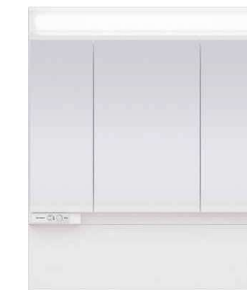
スタンダードLED3面鏡 ミドルパネル