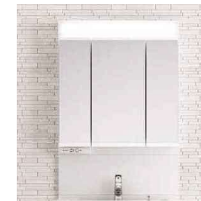
長寿命で経済的なLED。蛍光灯に 比べて電気代も節約できます。