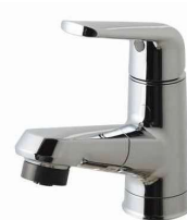
マルチシングルレバーシャワー (メタルタイプ) ※シャワーヘッドは引き出せます。