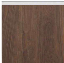
ウォールナット柄