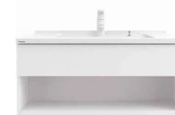
フロントオープンタイプ