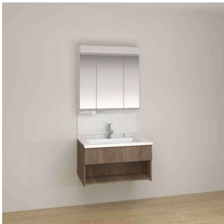
※画像はイメージです。組合せなどはお見積書をご確認ください。