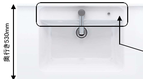
(画像は幅900mm) ●ボール深さ:165mm 容量:12L