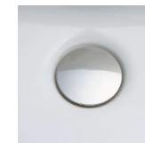
掃除しにくいフチの 隙間がない排水口。