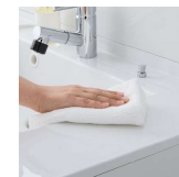
水に濡れた物を置くのに便利な ウェットエリア。継ぎ目や隙間がなく、 汚れてもささっと拭くだけ。