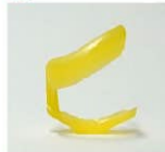
引き抜いたプルリングを横から見た図