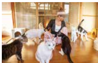
人と動物が安心して暮らし続けられる 社会を目指す「動物愛護の会 アベニール」

A ボランティア団体援助金は組合員さんの「世界に限らず沖縄の子どもたちも支援してほしい」という声に応じて2007年度に始まり昨年で18回目。これまでに272団体へ1,360万円を贈呈してきたの。これもひとえに募金してくれた組合員さんのおかげね。