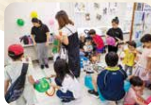
遊びながら地域交流を楽しむ子どもたち

『マチナトがんじゅうフェア』は、今後も市民団体が一体となり、地域に根ざした取り組みとして、子どもから高齢者まで幅広い世代が安心して参加できるよう継続していきます。