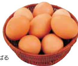
産直やんばる 赤たまご