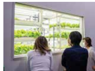
センター内でレタスとサンチュの水耕栽培も