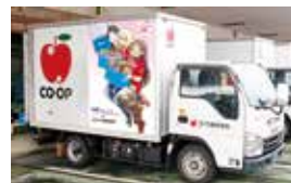
街中でラッピングトラックを探そう!

2025年12月より、沖ツラコラボのラッピングトラックが沖縄本島内を走行中!このトラックの写真を撮って、SNS (Instagram・X) に「#コプツラ」をつけてご投稿いただいた方の中から抽選でコープ商品をプレゼントします。