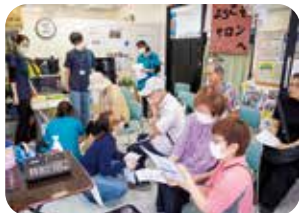
各種測定で自分の状態を確認する皆さん

会場のコープ牧港では、看護師・保健師による骨密度や血圧、血管年齢の測定コーナーが設置され、親子連れや夫婦が