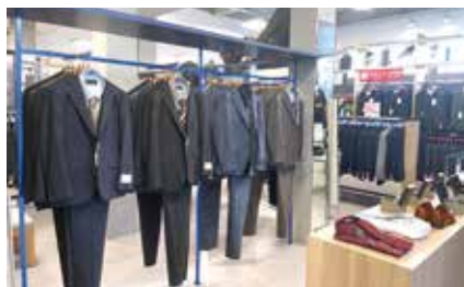
TPOに合わせて選べる豊富な品ぞろえ (写真は那覇新都心店)

スーツ選びにおいて大切なのは、適切なサイズ感です。スーツのサイズは、S M Lといったサイズ表示と異なるため、初めてスーツをご購入される方からは「このサイズで合っているのかわからない」というご質問が多いです。