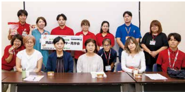
見学会の最後に、参加者の皆さんと記念撮影。学びと交流の一日となりました