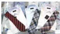
フレッシャーズにおすすめの コーデインイト

ジャケット着用の際、男性は一番下のボタンは留めない、女性はすべてのボタンを留めるというのも、意外と知られていないマナーです。