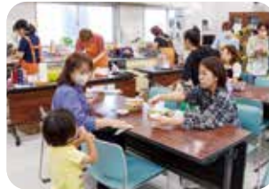
健康チェックの後はカフェでほっと一息

順番に体験しながら自分の健康状態を確認していました。管理栄養士による「ベジチェック」では、野菜の摂取量を測定しながらアドバイスを受けられ、楽しみながら健康意識を高める場となりました。