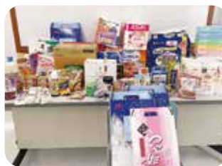
組合員さんから寄付いただいた商品の一部

回を重ねるごとに浸透しているスマイルピックアップ。今後多くの方へのお役立ちができるよう取り組みを進めていきますので、引き続きご協力をお願いします。