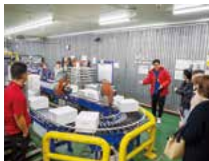
冷蔵商品を丁寧に詰める工程も見学

コープおきなわの原点ともいえるこの商品は、組合員の声をもとに改良を重ねながら長年親しまれてきたものです。今回は、50周年記念事業の一環として検討されているポーク缶のラベルシール(缶のまわりに貼られている部分)のリニューアルについても紹介されました。缶を廃棄する際、「ラベルシールが剥が