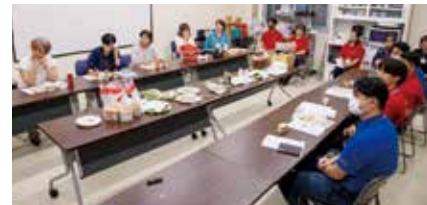
ポーク缶をより使いやすくするため意見交換

学習後は、ポーク缶と、同じく南部東ブロックの組合員が携わった食パンやレタスで作ったサンドイッチを試食。コープの商品づくりへの思いに触れながら、参加者全員でその味を確かめるひときととなりました。