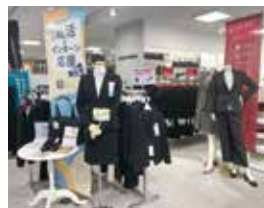
レディースコーナーも充実

はるやまでは、サイズ測定はもちろん、試着用のワイシャツやブラウスもご用意。特に、初めてのスーツ選びのサポートに力を入れていますので、お気軽にご相談ください。2月2週目頃から混み合うため、早めのご来店をおすすめします。