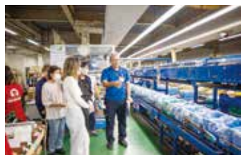
レールの上をコンテナが流れる様子は、まるで小さな列車のよう