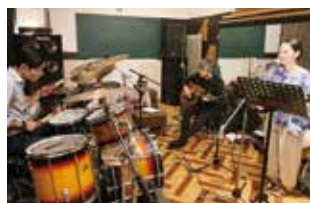
公式テーマソングの制作風景

2025年11月末にスタジオ収録を行い、2月の公開に向け追加収録や編集作業進行中です。コープおきなわのイメージにふさわしい親しみのある曲の完成を目指しています。完成後はコープのお店やCMなどで活用し、コープおきなわの認知度アップを目指します。