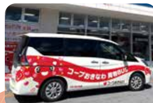
かわいいコーすけが描かれた買物BUS