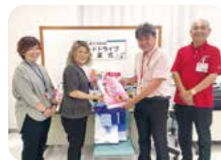
コープ牧港で行われた浦添市福祉協議会への贈呈式