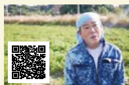
大保さんの人参紹介動画