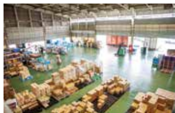
大量の商品箱が積み上げられた広い倉庫