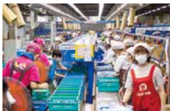
注文に合わせて、てきぱきと商品を仕分け

スの現状などについて詳しい説明がありました。参加者は実際の現場を見学しながら、商品の安全・品質管理や、職員の丁寧な作業によって支えられていることを実感していました。