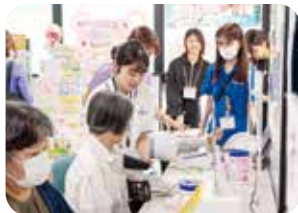
看護学生もボランティアで参加

順番に体験しながら自分の健康状態を確認していました。管理栄養士による「ベジチェック」では、野菜の摂取量を測定しながらアドバイスを受けられ、楽しみながら健康意識を高める場となりました。