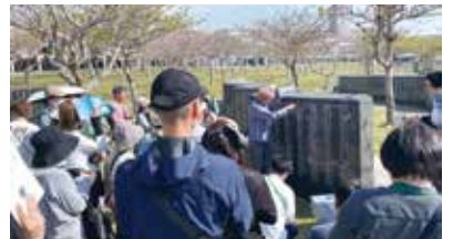
平和の礎にて、平和ガイドの説明に熱心に耳を傾ける参加者

首里城、平和創造の森公園、ひめゆり平和祈念資料館、山城本部隊、魂魄の塔、対馬丸記念館、嘉数高台公園