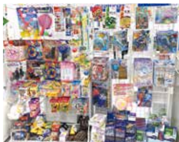
おもちゃが並ぶ景品コーナー。 右側はスタンプ20個用(あつぶるタウン)

けお菓子、おしりふきなどからも選べます。スタンプが貯まるのを楽しみに来店されるお子さんが多いことから、台紙の枠を増やし、スタンプが20個貯まるともらえる景品も用意しています(店舗ごとに内容は異なります)。