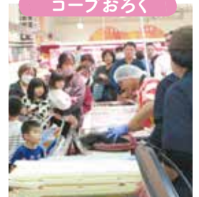
販わいをみせた「まぐろ解体ショー」