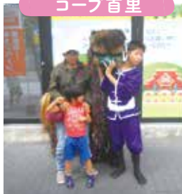
汀良町青年会による獅子舞演舞&写真撮影会