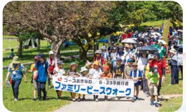
毎年、慰霊の日を開催している「6.23ファミリーピースウォーク」。 昨年も、多くの親子が参加しました

沖縄戦から80年を超えた今、平和なくらしを次世代へどのように受け継いでいくかが問われています。あらためて、沖縄戦の実相や戦後史、そして現在の沖縄について学び、大人も子どもも一緒になって平和について考えてみませんか。