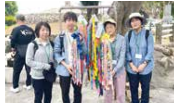
広島から参加の親子により魂魄の塔に千羽鶴が手向けられました