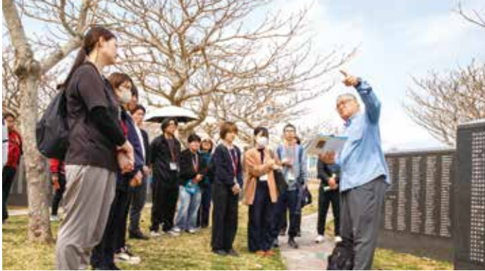
新入協職員が平和の礎の前に、刻まれた名前一つひとつと向き合っています