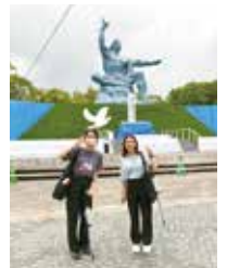
平和祈念公園の平和祈念像前にて