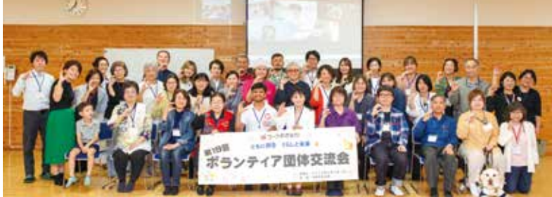
多様な分野で活動する団体が一堂に会し、それぞれの取り組みを支える場となりました