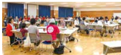
各団体から感謝や今後に向けた思いが語られました

当日は、子育て支援や医療・福祉、文化継承、地域防災、多文化共生など、さまざまな分野の団体が活動を紹介し、多彩な取り組みや思いが共有されました。