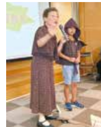
6歳のころに被爆した八木さんの証言

黒い雨や遺構を目の前に原爆の悲惨さを生々しく感じました。80年たっても被害者の問題が解決していないことも知りました。