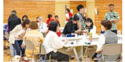
会場内を移動しながら思い思いに対話を深めました