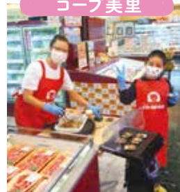
東伯牛の試食販売。うるま市ブロックメンバーの親子で頑張りました