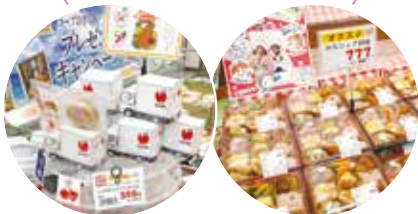
ファッションキャンディさんと共同開発した「ミックスカヤロットフィナンシェ」