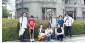
原爆ドーム前にて

2日目のメイン会場「虹のひろば」では、平和を願う唱歌やダンス、体験者による感想画の講演のほか、VRゴーグルで被爆の瞬間をリアルに体験できる展示ブースなども設けられ、沖縄からの参加者一同も、多くの学びを得ることができました。