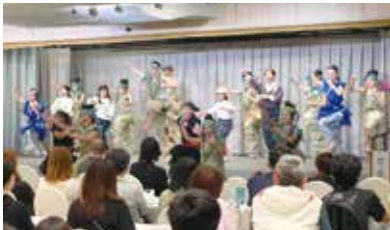
平和へのメッセージが込められた演劇

初日の全大会では、那覇青少年舞台プログラムによる対馬丸事件を題材にした演劇を鑑賞しました。那覇市近郊の小学5年生から高校3年生で構成されたメンバーたちのエネルギッシュな歌や踊りを通して、子どもも大人も平和へのメッセージを受け止めました。