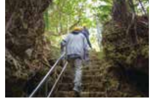
ガマの見学を終え、光の差す出口へ進みます

その後、戦没者の名前が刻まれた「平和の礎」や、沖縄で最初に建立された慰霊塔である「魂魄の塔」、多くの避難民が追い詰められた場所とさ