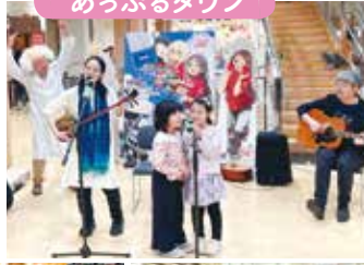
公式テーマソング「島中ぐるっと大きな輪」を披露