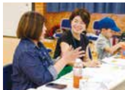
課題や経験を共有し意見交換が行われました