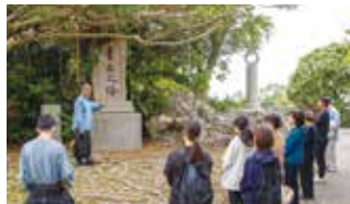
青丘之塔などの慰霊碑が点在しています