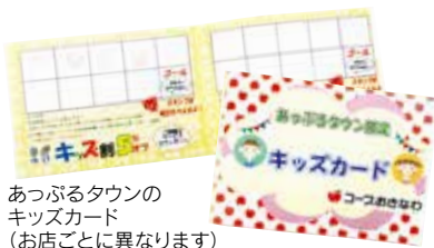
あつぶるタウンの キッズカード (お店ごとに異なります)

キッズカードは、「子連れでも気兼ねなく、楽しくお買い物をしてもらいたい」という思いでコープのお店で取り組んでいる子育て応援サービスの一つです。みやぎ生協の取り組みを参考に2024年春からあつぶるタウンでスタートしたところ、大変好評だったことから、現在はコープ牧港、コープ山内、コープ寒川、コープ美里、コープおろくの6店舗に広がりました。