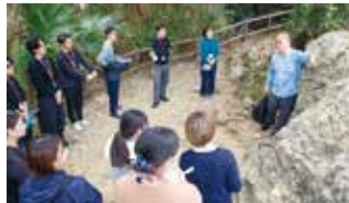
無数の弾痕が残る「トーチカ」

ついて学びました。暗く狭い空間に身を置くことで、戦時下の厳しい状況に思いを巡らせる様子が見られました。