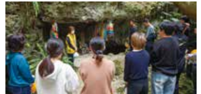
ガマの慰霊碑の前で、静かに思いを寄せるひととき

れる米須海岸を巡り、戦没者を追悼するとともに、平和の大切さについて改めて考える機会となりました。