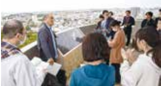
嘉数高台公園で解説に耳を傾ける参加者

最初に訪れた嘉数高台公園は、沖縄戦において首里防衛線の一角を担った場所です。園内には当時の陣地壕やトーチカ（攻撃拠点）が残されており、参加者は説明に耳を傾けながら、激戦の跡を見学しました。また、高台からは普天間基地を望み、現在の基地問題についても理解を深めました。