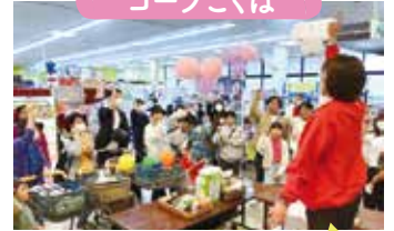
じゃんけん大会で大盛り上がり!