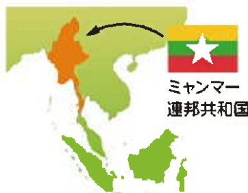
ミャンマー 連邦共和国

本キャンペーンでは、2014年度より2016年度まではガーナ、2017年度よりカンボジアを支援してきました。カンボジアでの学校給食の取り組みは同国政府に引き継ぐ段階まで大きく進展してきたことから、2020年度より支援国をミャンマー連邦共和国に変更します。ミャンマーにおける学校給食の本格的な取り組みは2017年からと比較的遅く、圧倒的に資金が足りていません。