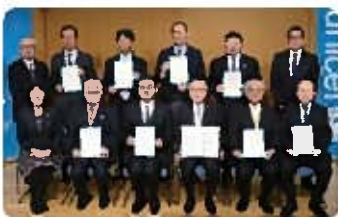
贈呈式の 参加者たち

プロジェクト第9期（2018年11月～2019年10月）では、各地の生協が対象商品の利用を呼びかけ、1年間で約1,119万円の募金が集まりました。12月に行われた贈呈式で、目録を贈呈しました。