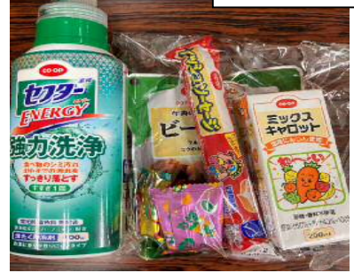
エシカル学習商品